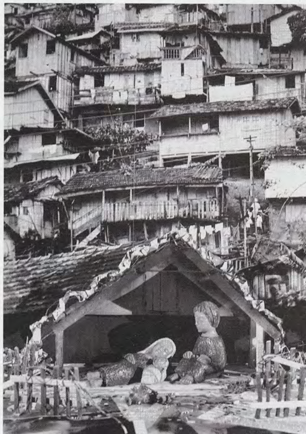
Żłóbek na tle „faveli” w Rio de Janeiro.