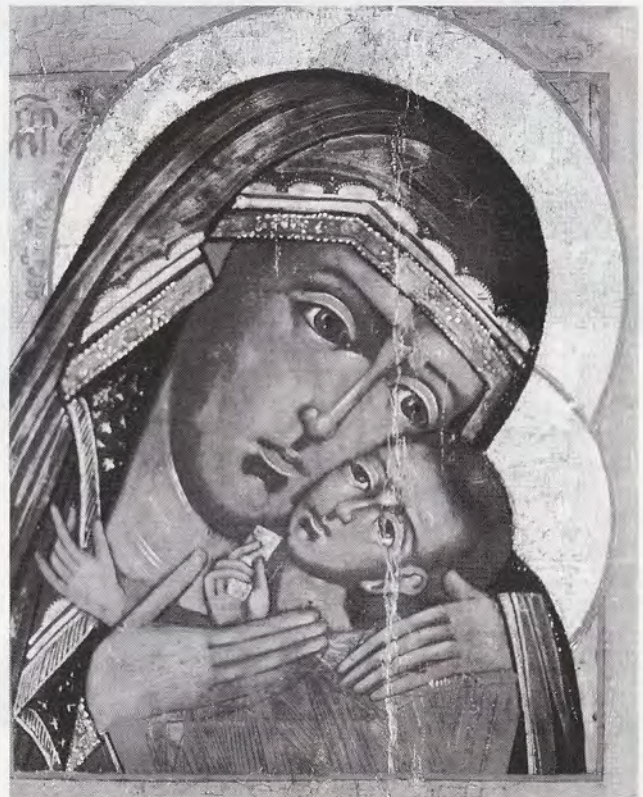
Matka Boska Korszuńska

Misyjne Drogi — dwumiesięcznik prezentujący pracę ewangelizacyjną, ze szczególnym uwzględnieniem działalności Misjonarzy Oblatów Maryi Niepokalanej.