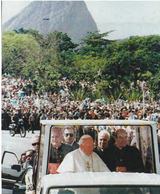
Jan Paweł II w drodze do parku Flamengo.