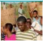
zdjęcie na okładce Comboni Press

8 WIADOMOŚCI Z ŻYCIA HOŚCIOŁA Powołani, aby ukazywali blask Słowa prawdy Orędzie na Światowy Dzień Misyjny 2012