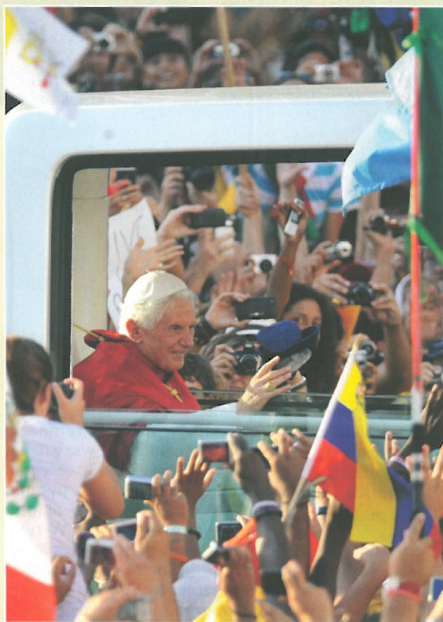
Przybycie Benedykta XVI na Plac Cibeles