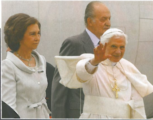
Powitanie Ojca Świętego przez parę królewską na lotnisku w Madrycie