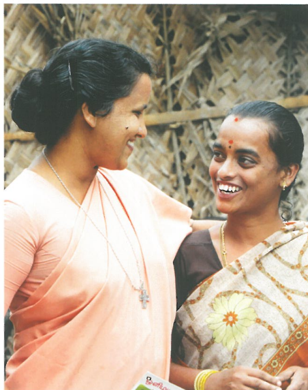
Siostry Shobhana i Valaematki w Shridevi w Tamil Nadu w Indiach

Misyjne Drogi – dwumiesięcznik prezentujący pracę ewangelizacyjną, ze szczególnym uwzględnieniem działalności Misjonarzy Oblatów Maryi Niepokalanej