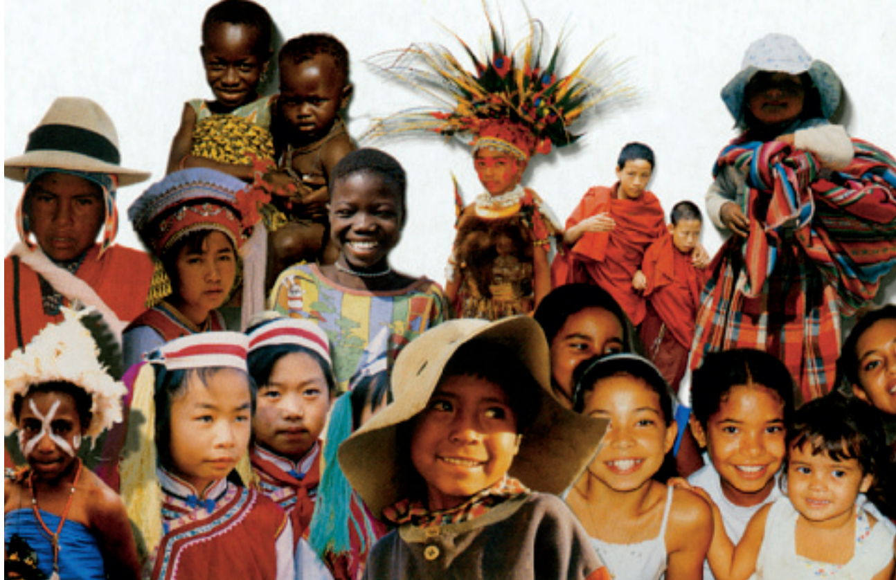
Dzieci całego świata w Papieskim Dziele Misyjnym Dzieci