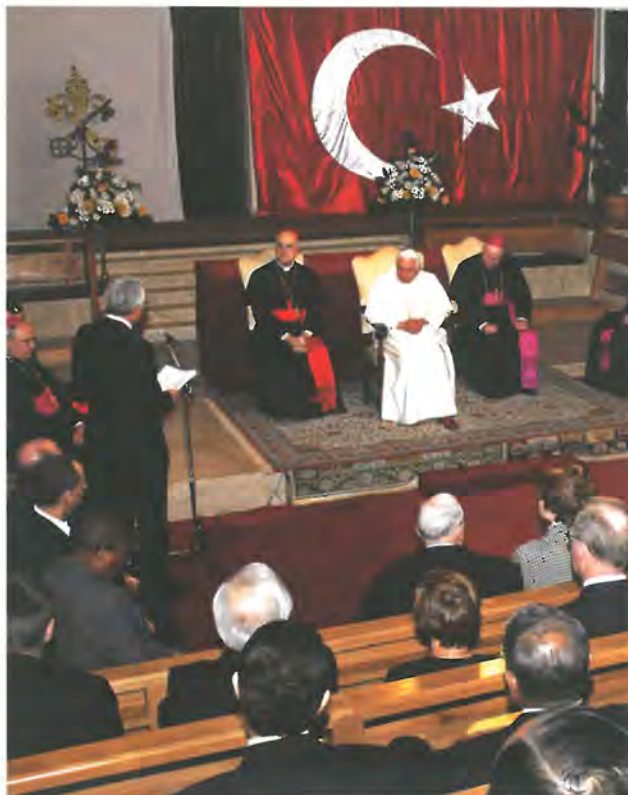
W czasie spotkania z korpusem dyplomatycznym 28 XI 2006 r. w Ankarze

z przemówienia Benedykta XVI do korpusu dyplomatycznego w Ankarze 28 listopada 2006 r.