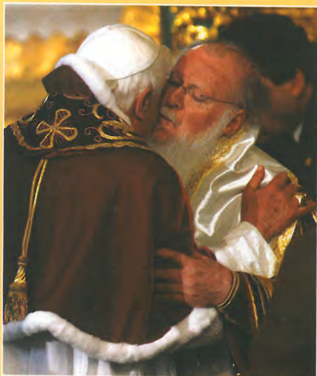
Papież Benedykt XVI i Patriarcha Ekumeniczny Bartłomiej I podczas spotkania w Stambule 30 XI 2006 r.