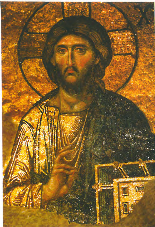
Mozaika Chrystusa ocalała w Hagia Sophia, kiedyś najwspanialszej świątyni chrześcijaństwa