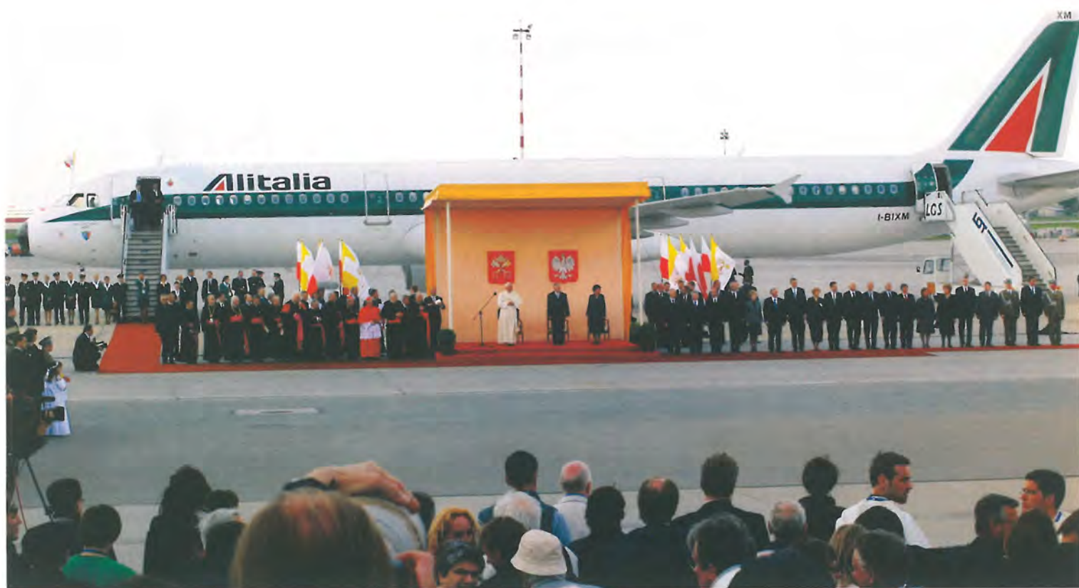
Benedykt XVI przybył na lotnisku na Okęcie w Warszawie w południe 25 V 2006 r.