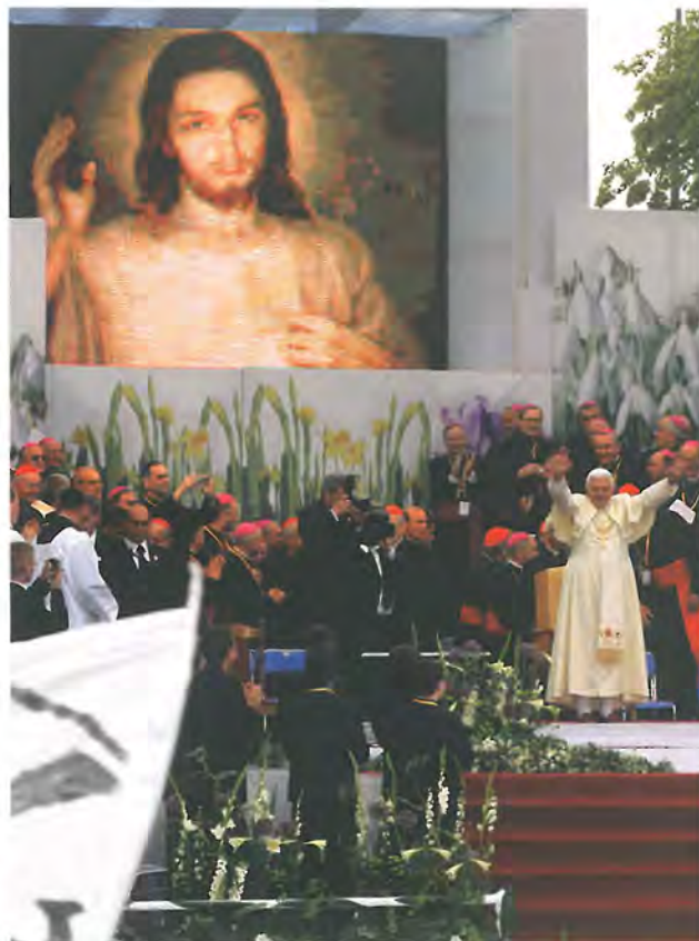
Na krakowskich Błoniach

Misyjne Drogi – dwumiesięcznik prezentujący pracę ewangelizacyjną, ze szczególnym uwzględnieniem działalności Misjonarzy Oblatów Maryi Niepokalanej