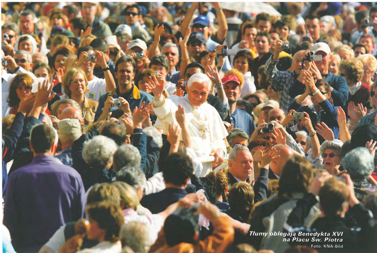
Tłumy obiegają Benedykta XVI na Placu Sw. Piotra