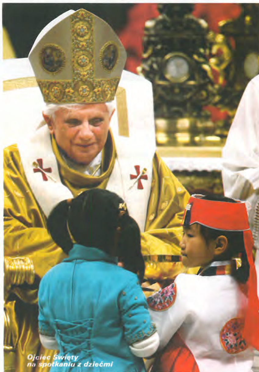
Ojciec Święty na spotkaniu z dziećmi

W 1952 r. ks. Józef Ratzinger został wykładowcą w monachijskim seminarium duchownym, gdzie się habilitował. Był profesorem teologii na uniwersytetach w Monachium, Bonn, Mün-