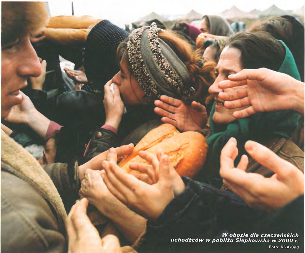
W obozie dla czeczeńskich uchodźców w pobliżu Slepowska w 2000 r.

W niedawnym Liście apostolskim Mane nobiscum Domine zachęciłem do kontemplowania Jezusa, „Chleba łamanego” dla całej ludzkości. Biorąc z Niego przykład, również i my powinniśmy dawać życie za braci, zwłaszcza za najbardziej po-