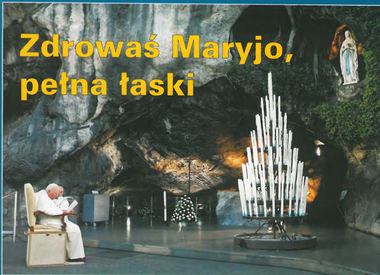
W dniu przybycia Jan Paweł II przywitał pielgrzymów u stóp Niepokalanej w grocie Massabielle