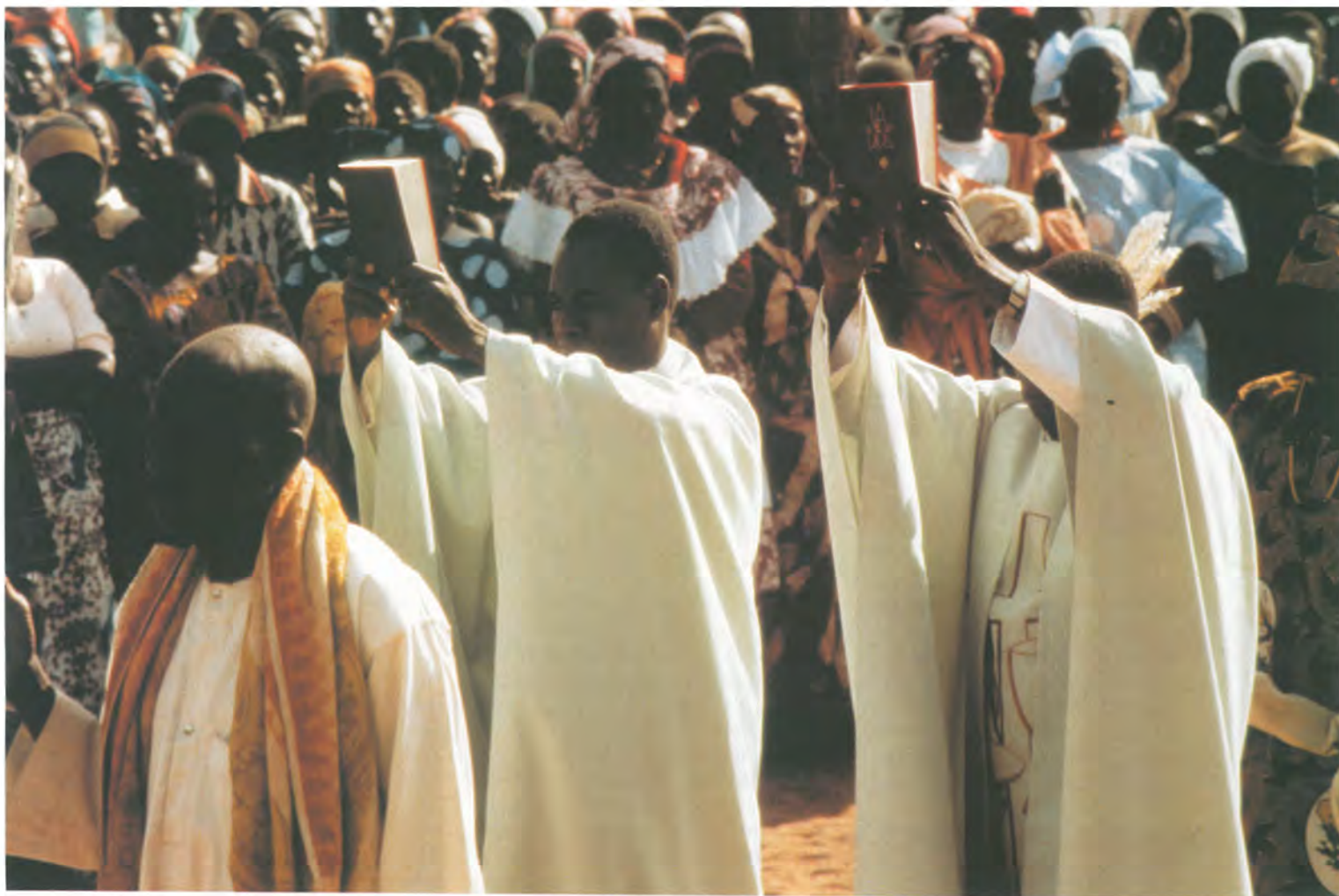
Neoprezbiterzy niosą Pismo Święte w uroczystej procesji w Dogonie w Mali