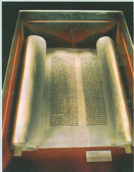
Tak zwinięty Stary Testament (Tora) używany jest w synagogach do dziś

Kościoła, zawiera wszystko, co Bóg zechciał objawić ludziom o sobie samym, o człowieku, o historii ludzkości i o dziejach świata. Św. Augustyn mawiał, iż Biblia jest świadectwem, które Bóg daje sam o sobie . Ostatni Sobór przypominał, iż działalność misyjna polega jedynie i wyłącznie na okazaniu