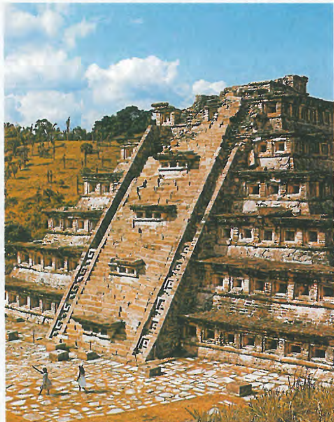
Liczne są świadectwa bogatych dziejów Meksyku.

Już przed przybyciem Hiszpanów na terenach dzisiejszego Meksyku rozwinęły się wielkie kultury Olmeków, Tolteków, Majów i Azteków. W czasie hiszpańskiej konkwisty nad większością jego terenów panowali Aztekowie. Niedługo po przybyciu do Nowego Świata Fer-