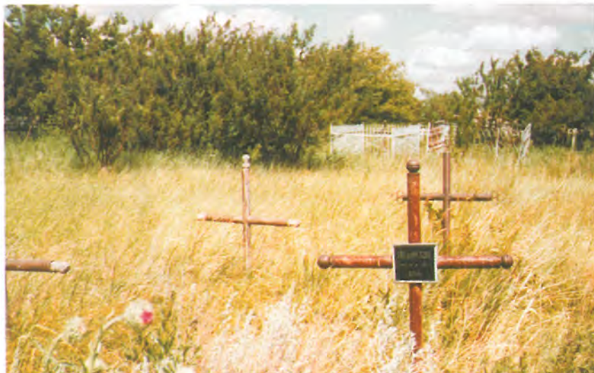
Groby pierwszych zesłańców w Oziornym.

Poczynając od VI w. po Chrystusie, w kolejnych wiekach na terenach Kazachstanu powstawały i upadały rozmaite związki plemienne. Podbój Azji przez Dżyngis-chana spowodował olbrzymie przemieszanie się ludności i jej jednoczenie się w ramach wielkich organizmów politycznych. Po upadku Złotej Ordy i krótkotrwałego imperium Tamerlana w XV w., w wyniku walk wewnętrznych powstał m.in. chanat uzbeki, z którego później wyłonił się chanat kazachski. Określenia: Uzbek i Kazach nie miały wtedy jeszcze znaczenia etnicznego. Kazach oznaczał człowieka wolnego. Na przełomie XV i XVI w. Kazachowie umocnili swoje imperium (chanat kazachski), kontrolując w pewnych okresach cały obszar stepów. W XVI w. roz-