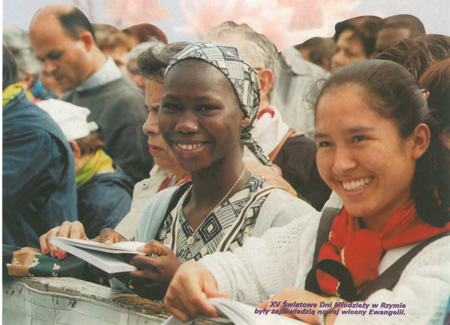
XV Światowe Dni Młodzieży w Rzymie były zapowiedzią nowej wiosny Ewangelii.