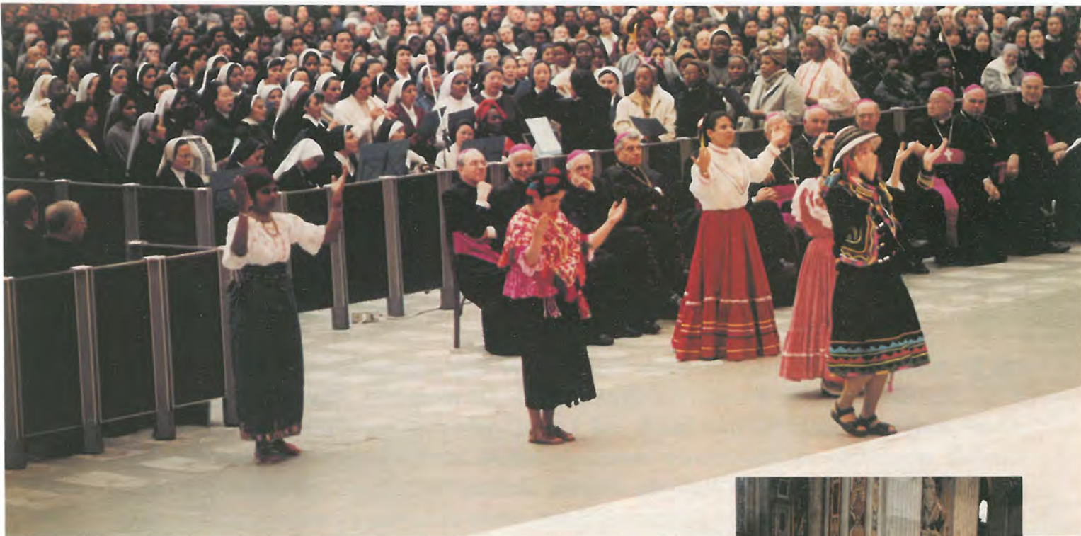
Na zakończenie uroczystego sympozjum i podczas Mszy św. w Bazylice Św. Piotra.