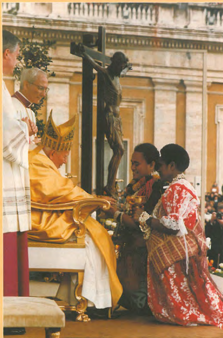
Procesja z darami podczas Mszy św. w uroczystość Objawienia Pańskiego 2001 r.