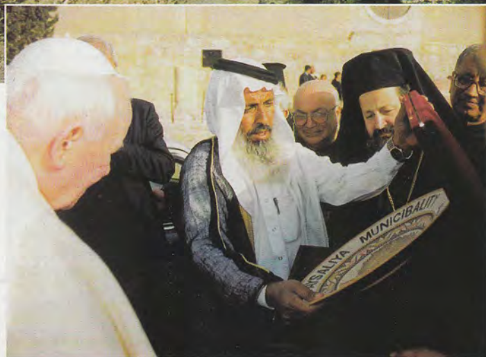
Wręczenie darów przy Bazylice Mojżesza.