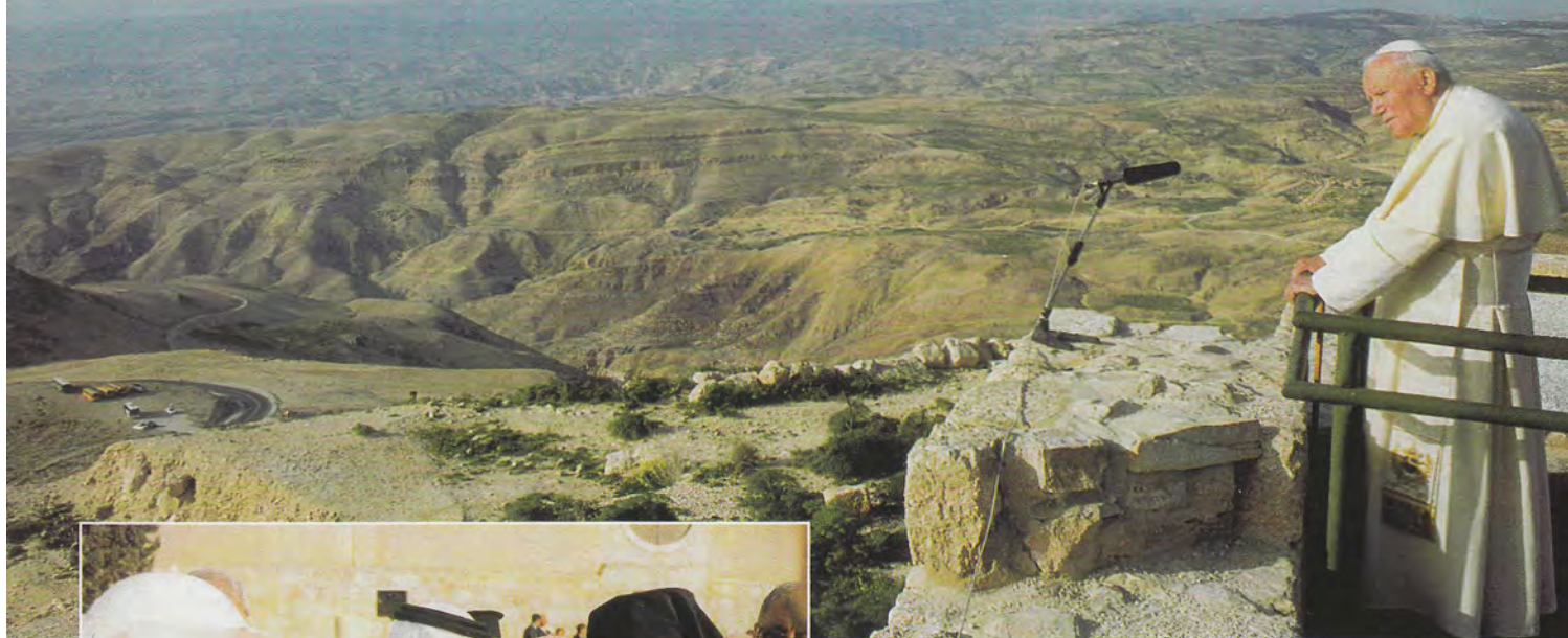
Papież jak Mojżesz spogląda z Góry Nebo na Ziemię Świętą.

Pielgrzymka Jana Pawła II do Jordanii, 20–21 marca 2000 r