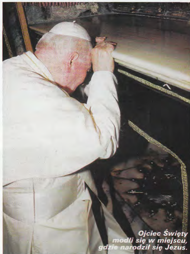
Ojciec Święty modli się w miejscu, gdzie narodził się Jezus.