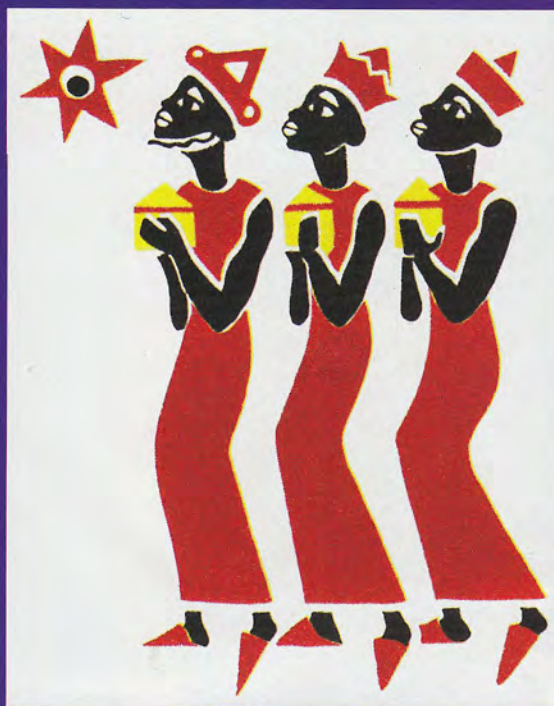
Pokłon Trzech Króli z De Keur Moussa w Senegalu.

(Edyta Stein: Fragment medytacji z okazji uroczystości Objawienia Pańskiego)