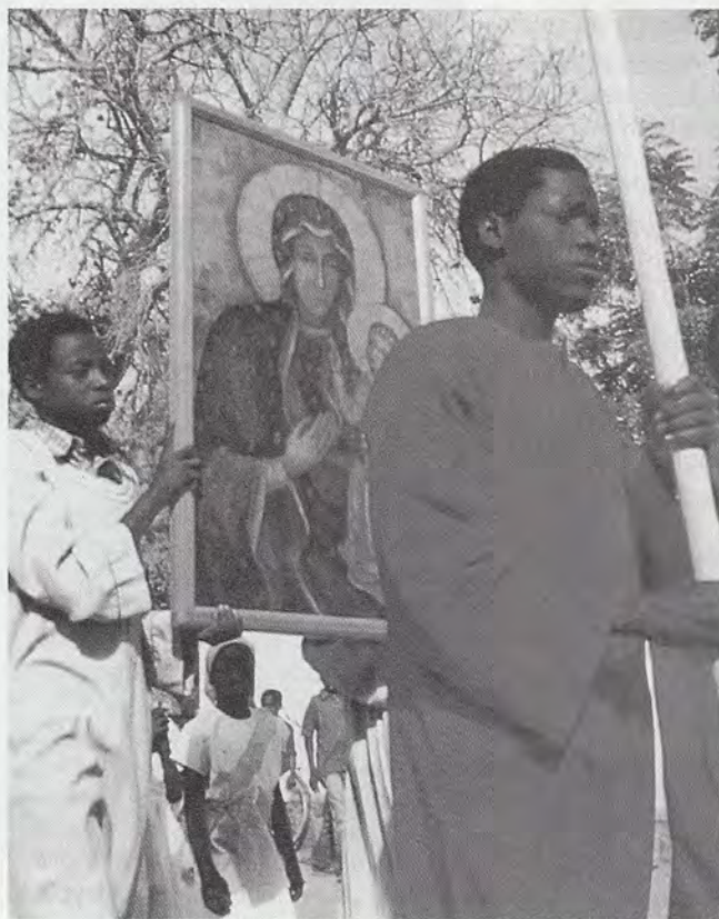
Czarna Madonna odbiera cześć także w Afryce.