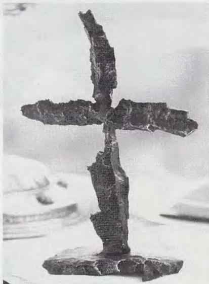
Bóg pragnie, by ludzie żyli w pokoju. Krzyż zrobiony z odłamków granatów.

Gdzie jest Bóg? Gdzie On jest? — zapytał ktoś z tyłu mnie”.