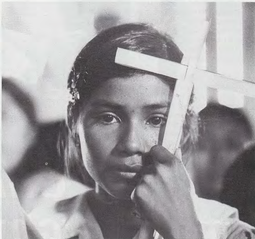
Dziewczyna z Esperanza w Nikaragui z krzyżem z liści palmowych.

„Pewnego dnia, po powrocie z pracy, zobaczyliśmy na placu apelowym trzy szubienice. Dookoła nas stali esesmani z karabinami maszynowymi gotowymi do strzału — codzienny obozowy rytuał. Trzy ofiary zakute w kajdany. Jedną z nich jest chłopiec, anioł o pokrytych smutkiem oczach. Esesmani byli bardziej niespokojni i nerwowi niż zwykle. Nie jest to przecież takie proste powiesić małego chłopca przed tysiącem naocznych świadków. Niech żyje wolność! — zawołali dorośli skazańcy. Dziecko jednak milczało.