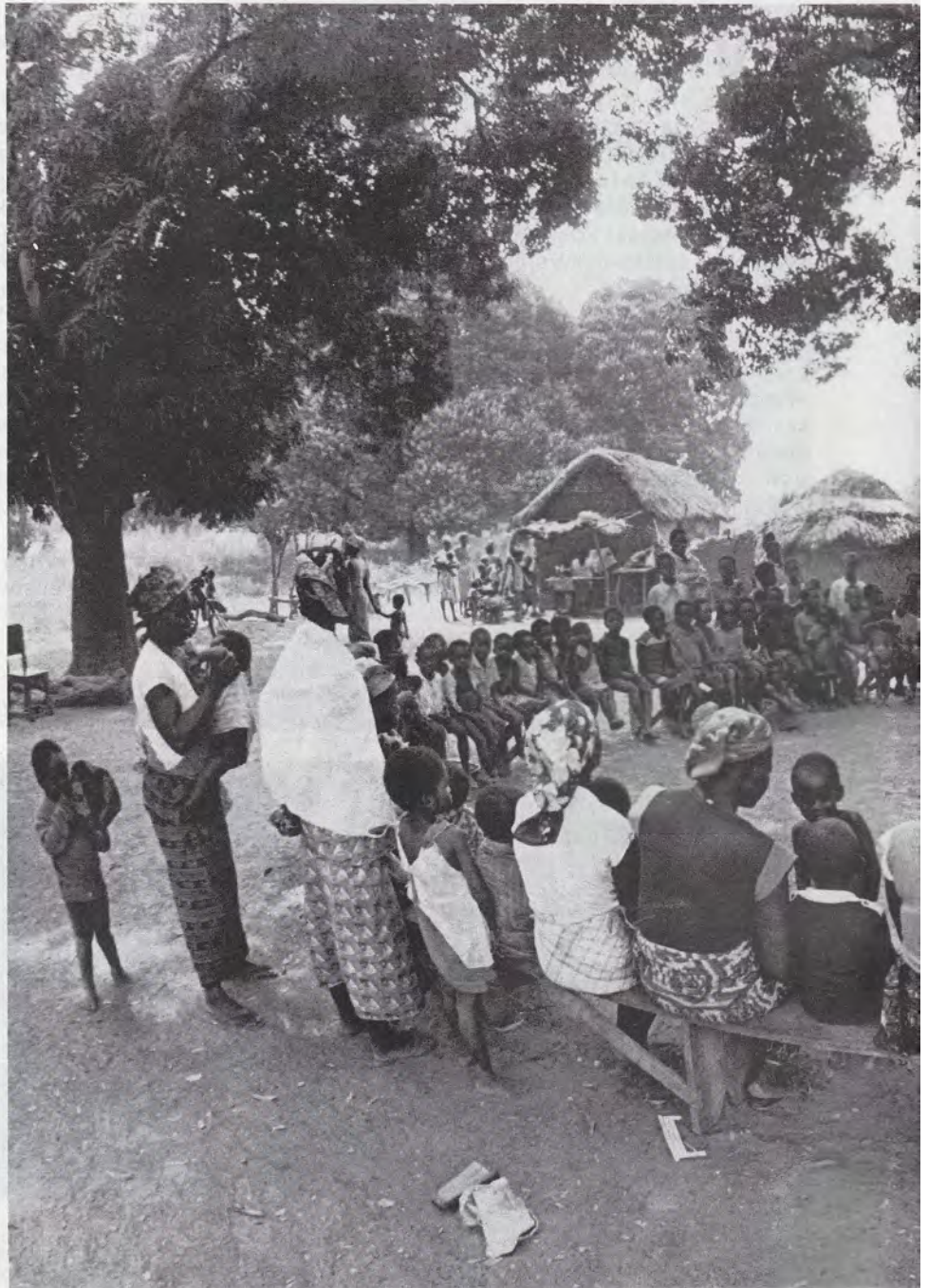
W Afryce powstaje wiele nowych, młodych wspólnot Kościoła. Msza św. w Balai (Ghana).

Sytuacja pierwsza to „działalność misyjna Kościoła” lub „misja ad gentes ” (RMi 33), a więc działalność misyjna w sensie ścisłym,